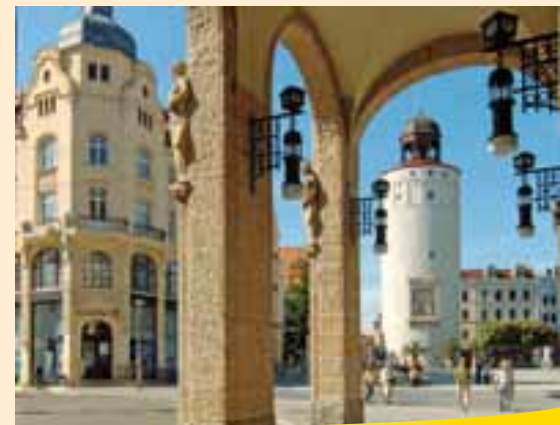
Pohled od secesního obchodního domu na Tlustou věž