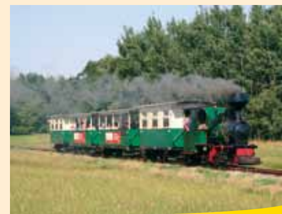
Lesní železnice Muskau