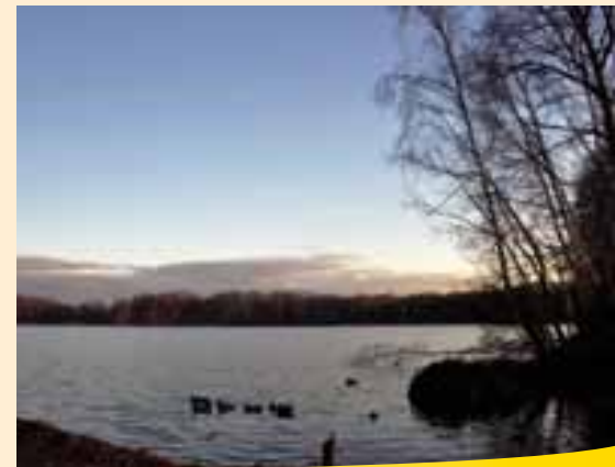
Hrádek nad Nisou, Kristýna-See

Nedaleko místa, kde se setkávají Česká republika, Německo a Polsko, leží Hrádek nad Nisou. Město, o němž je první písemná zmínka z roku 1235, leželo na důležité obchodní cestě z Čech přes Lužici až k Baltskému moři. V okolí Hrádku se těžil lignit. Jeden z lomů byl později zaplaven a dnes je Kristýna oblíbeným místem pro rekreaci. Rekreační areál nabízí ideální podmínky pro koupání, surfování, další vodní sporty a také rybaření. Na Kristýně je také možné využít půjčovny lodí a vypravit se po proudu řeky Nisy do sousedních zemí či možnosti lanového centra.