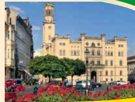
Radnice v Žitavě