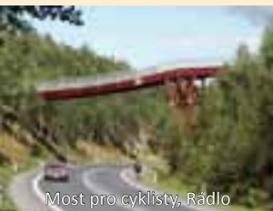
Most pro cyklisty, Rádlo