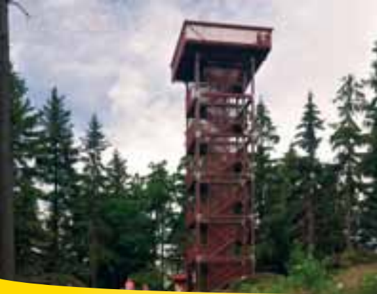
Rozhledna „Císařský kámen“, obec Rádlo

Cyklostezka podél Nisy vede do Jablonce nad Nisou, do města, které je celosvětově známé jako centrum sklářského průmyslu a obchodu s bižuterií. O dřívějším bohatství svědčí významné stavby v převažujícím secesním stylu a dodnes fungující sklárny, kde je možno si zajistit prohlídku. V obci Milíře stojí na Císařském vrchu 20 metrů vysoká dřevěná rozhledna, která byla postavena v roce 2009. Z ochozu rozhledny se otevírá výhled na jižní svahy Jizerských hor, západní část Krkonoš, města Jablonec nad Nisou a Liberec a také Ještědsko-kozákovský hřbet.