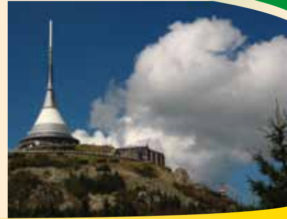
Vrchol Ještědu s rozhlednou

Liberec je s více jak 105 000 obyvateli centrem českého severu. Obraz města byl vytvořen při přestavbách na konci 19. století. Reprezentativními budovami v neorenesančním stylu jsou radnice, spořitelna, muzeum, lázně a divadlo. Za návštěvu jistě stojí i botanická zahrada, ZOO či aquapark. Dominantou města i celého Libereckého kraje je unikátní stavba na vrcholu Ještědu (1.012 m n.m.), Projekt televizního vysílače a horského hotelu je dílem architekta Karla Hubáčka, který za něj byl oceněn prestižní Perretovou cenou Mezinárodní unie architektů.