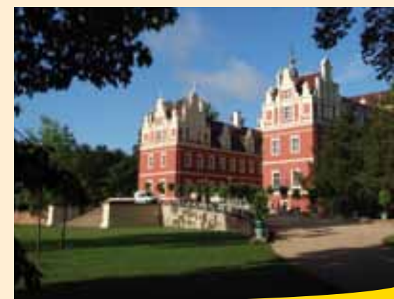
Nový zámek v parku knížete Pücklera v Bad Muskau

Za významnou kulturní krajinu je považován geopark Muskauer Faltenbogen se svou geologickou rozmanitostí. Na jihu přírodní přeshraniční oblasti leží Weißwasser. Z rozhledny na Těžké hoře uvidíte celý povrchový důl Nochten až k elektrárně Boxberg. Z Weißwasseru si můžete udělat výlet lesním vláčkem Muskau až do parku v Muskau. Nebo do parku rododendronů v Kromlau s jeho jedinečným mostem.