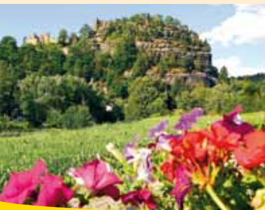
Přírodní park Žitavské hory

Přírodní park Žitavské hory je krajinným klenotem jihovýchodní Horní Lužice. Zvláštní půvab nejmenšího německého středohoří se odráží v pískovcových horách, vulkanických kupách a malebných údolích. Skutečný ráj pro poutníky láká četnými stezkami, nádhernými výhledy a překvapujícími skalními útvary. V kulturní krajině Vás nadchne kromě jiného zřícenina hradu a kláštera Oybin, přírodní chráněná oblast „Jonsdorfské skalní město“ nebo jedinečné hornolužické podstávkové domy.