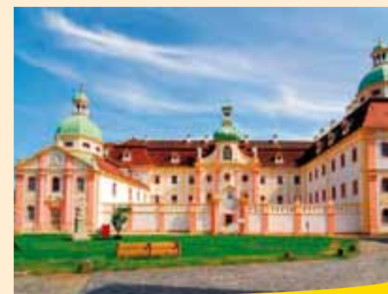
Klášter St Mariethal v Ostritz