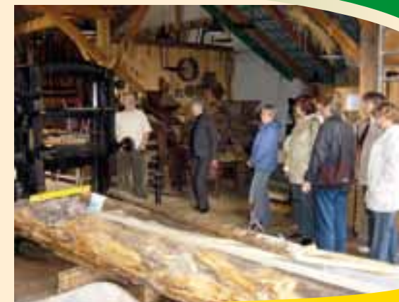
Pila v Sagaru

Novým objevem je lesní a zemědělsko-historické předváděcí zařízení v Sagaru. Láskyplně zařízené muzeum nechává nahlédnout do hospodaření dřívějšího stavovského panstva Muskau. Zde je možné obdivovat více jak 110 let starou rámovou pilu, historické hračky, zařízení domácnosti z minulých dob a další rarity. Také ze Sagaru je možné zažít Nisu a její překrásnou floru a faunu z nafukovacího člunu. Odpočinek a uvolnění nabízí saunová vesnička se svými dřevěnými sruby a zážitkovým světem v Krauschwitz.