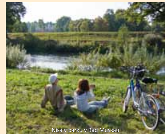
Nisa v parku v Bad Muskau

Slavné zahradní umělecké dílo leží navíc v geoparku Muskauer Faltenbogen, což je zemědělsky i kulturně ojedinělý přírodní prostor. Cyklisti jedou zpravidla na oddělených cestách s malým převýšením a v malé vzdálenosti od Nisy. S touto brožurou získáte komplexního průvodce. Přehledně zpracované tipy Vám pomohou, aby se Vaše dovolená v rozmanité pohraniční oblasti stala nezapomenutelným zážitkem.