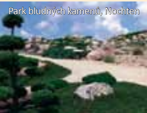
Park bludných kamenů, Nochten