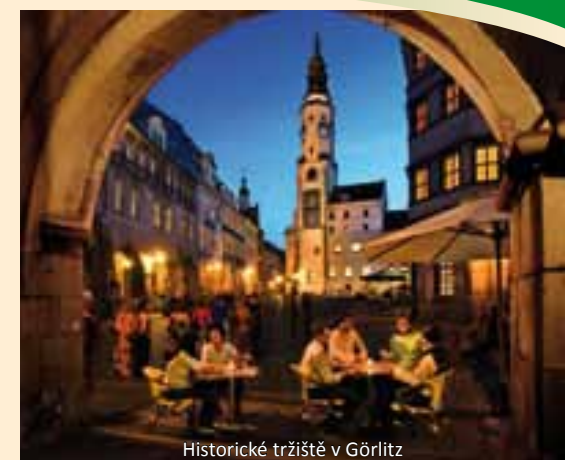
Historické tržiště v Görlitz

Ten, kdo se vydá na cestu v česko-polsko-německém trojzemí, pojedje po proudu řeky starými městy s bohatou historií, zasněnými místy, romantickými parky a idylickými údolími. Projede se po lesích, polích a loukách. Vplatí se naplánovat si na cestu podél Nisy dostatek času, třeba na zajížděku do přírodního parku Zittauer Gebirge (Žitavské hory), který je možné prohlížet po obou stranách hranice. Nesmírně zajímavými zastávkami na cestě jsou historická města Žitava a Görlitz s jejich působivou architekturou nebo Fürst-Pückler-Park v Bad Muskau, patřící ke světovému kulturnímu dědictví.