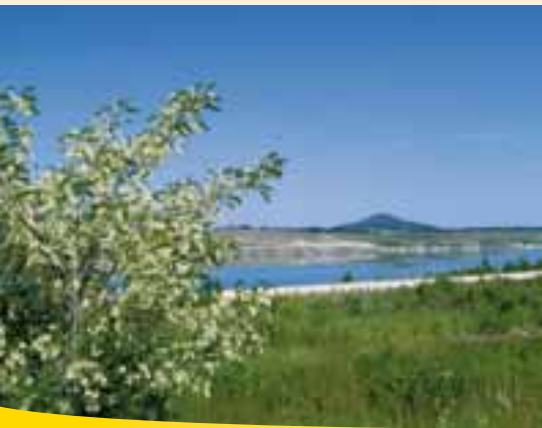
Berzdorfské jezero a Landeskrone

Dřívější těžbu hnědého uhlí jižně od Görlitz připomíná korečkový bagr, který můžete navštívit v Hagenwerderu. Důl uzavřený roku 1997 se postupně proměnil na Berzdorfské jezero, které se dá objet po stezce dlouhé 18 km.