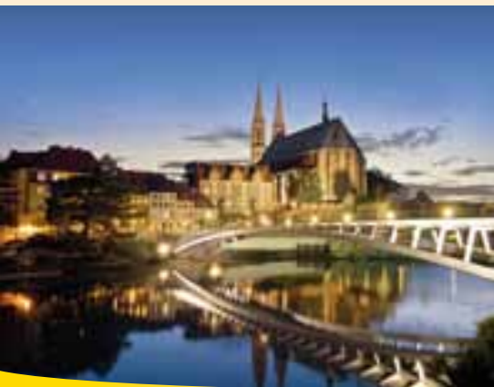
Kostel Sv. Petra u Staroměstského mostu

Od roku 1945 vyznačuje řeka Nisa německo - polskou hranici. U městské haly v Görlitz se dostanete do sousedního Zhořelce, kromě jiného i k domu kultury - monumentální stavbě, která vznikla v roce 1902 jako upomínka na císaře Wilhelma I. Na východním břehu vede cesta k Lužickému muzeu a k bývalému domu theosofa Jakoba Böhmeho (1575-1624). Odtud zbývá už jen pár kroků ke Staroměstskému mostu.