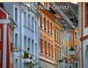
Ulice U Nisy, Görlitz