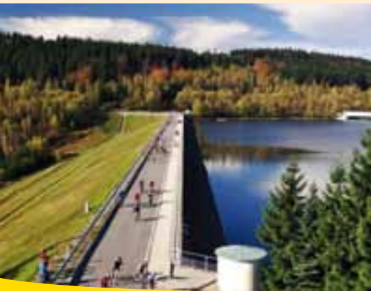
Přehrada „Josefův Důl“ v Jizerských Horách

Jizerské hory jsou nejseverněji položeným pohořím České republiky. Nejvyšším vrcholem na české straně je Smrk (1.124 m n.m), na jehož vrcholu byla v roce 2003 postavena 20 metrů vysoká rozhledna, která je jednou ze 14 rozhleden na území Jizerských hor. Vrchol Smrku býval odpradávná místem, kde se scházely hranice tří zemí: Čech, Horní Lužice a Dolního Slezska. Charakteristické jsou pro Jizerské hory rašelinné horské louky, bukové lesy a divoká skalnatá údolí s vodopády horských potoků. Jsou zde i dvě velké přehrady - Souš a Josefův Důl.