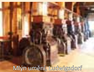
Mlýn umění, Ludwigsdorf