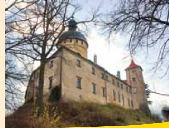
Zámek Grabštejn západně od Bílého Kostela

Nedaleko Machnína je přes řeku vidět zřícenina hradu Hamrštejn. Zachovány zůstaly hradby, zbytky druhé věže a obytné budovy, stejně jako sklep vytesaný do skály. V Chrastavě stojí za návštěvu hasičské muzeum. Západně od Bílého Kostela leží hrad a zámek Grabštejn, který je jedním z nejstarších hradů v Libereckém kraji. Původně gotický hrad byla později přestavěn v renesančním stylu a v současné době vyniká kaplí sv. Barbory, která se pyšní vzácnou výmalbou. V letní sezóně se na Grabštejně konají kulturní a společenské akce, koncerty, výlety do historie a divadelní představení pro celou rodinu.