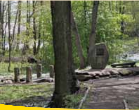
Obelisk u pramene Nisy

Cyklostezka Odra-Nisa začíná u pramene Lužické Nisy, poblíž obce Lučany nad Nisou. Pramen je označen obeliskem, který zde byl postaven v roce 1980. Prameniště Lužické Nisy se stalo inspirací pro pojmenování nedaleké rozhledny, ke které vede od pramene naučná stezka. Rozhledna Nisanka, která se nachází v nadmořské výšce 676 m, byla postavena v roce 2006 jako kombinace rozhledny a telekomunikační věže a nabízí nádherné výhledy na Jizerské hory, Ještědský hřbet a Krkonoše. Nedaleko rozhledny čeká na výletníky lanové centrum, které patří k největším v Libereckém kraji.