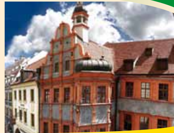
Slezské muzeum v Schönhofu