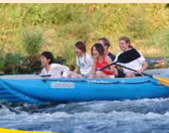
Jízda na člunu po řece Nisa

Na nafukovacím člunu nebo na kajaku lze po Nise zamířit do malého města Rothenburgu. V tomto maloměstě doporučujeme odbočku na náměstí s radnicí rekonstruovanou v roce 1994 nebo do městského muzea. Hned za evangelickým kostelem začíná městský park, se svými 11 hektary jeden z největších krajinných parků v Horní Lužici. K návštěvě láká také Muzeum letecké techniky na letišti v Rothenburgu.