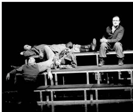
Szenenfoto mit allen Darstellern

6. Mai 2008, 10:00 Uhr 8. Mai 2008, 20:30 Uhr 8. Juni 2008, 19:00 Uhr 14. Juni 2008, 19:30 Uhr