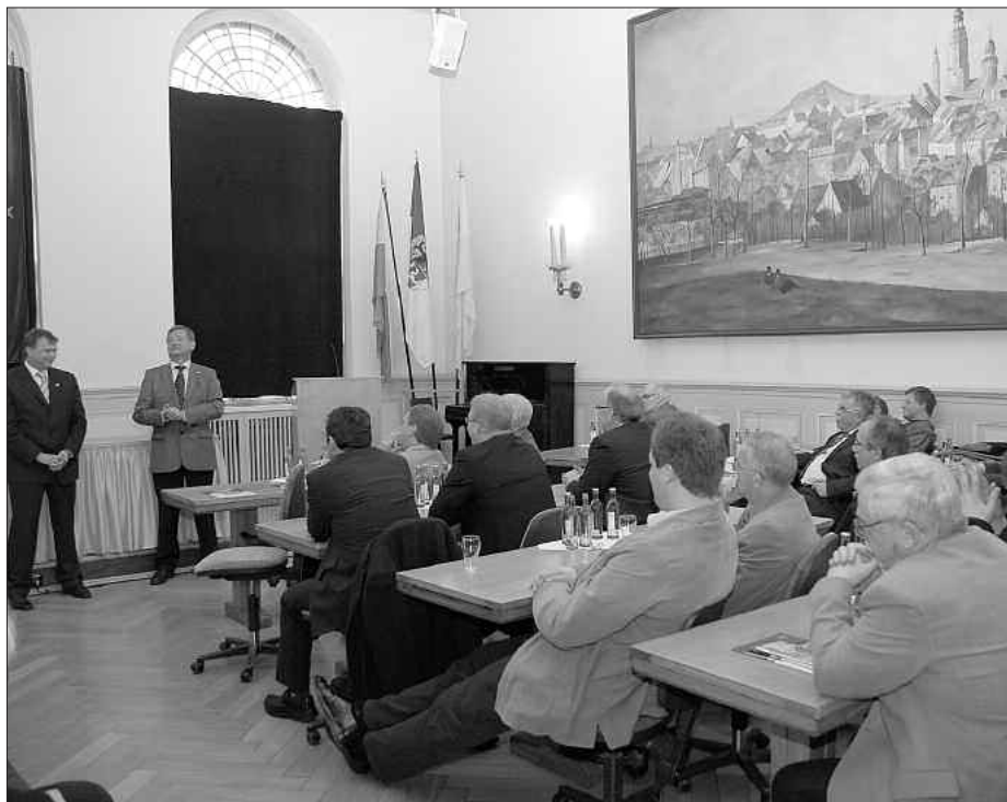
Oberbürgermeister Joachim Paulick begrüßte den Niedersächsischen Städte- und Gemeindebund, Kreisverband Osnabrück am 21. April 2008 im Rathaus.

Dieser demografische Effekt wird durch die Altersstruktur der Bevölkerung kompensiert, da ältere Menschen häufiger als jüngere krank sind und deshalb auch häufiger stationäre Leistungen in Anspruch nehmen. Des Weiteren weisen ältere Menschen häufiger als jüngere Patienten gleichzeitig mehrere Erkrankungen auf, sodass auch aus diesem Grund der stationäre Bettenbedarf entsprechend vorgehalten werden muss, um die Versorgung zu sichern.