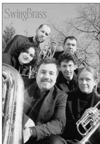
Gospel, Swing, Latin, Ragtime im Konzert, Sonntag, den 01.02.09, 15:00 Uhr Evang.-Freik.Gemeinde Görlitz, Bismarckstr. 15, Eintritt frei - um eine Spende für die Unkosten wird gebeten

Förderverein für regionale Entwicklung e.V. Am Bassin 12, 14467 Potsdam Tel: 0331/2002872 Fax: 0331/2002861 info@azubi-projekte.de www.azubi-projekte.de