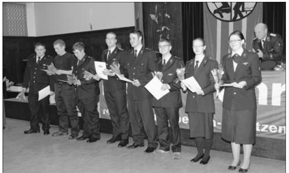
7 Kameraden und 2 Kameradinnen wurden nach erfolgreicher Ausbildung zum Feuerwehrmann bzw. Feuerwehrfrau befördert

Die Firma Dussa stellt seit vielen Jahren für die Ausbildung von Feuerwehrkameraden im Bereich technische Hilfeleistung sowie für Vorführungen der Feuerwehr bei öffentlichen Veranstaltungen kostenfrei alte Autos zur Verfügung. Auch Ausbildungen auf dem Fir-