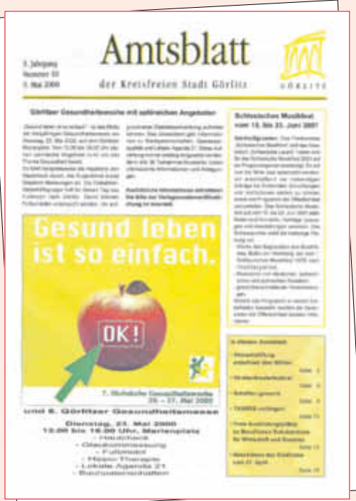
Ausgabe Nr. 10, 9. Jahrgang vom 9. Mai 2000