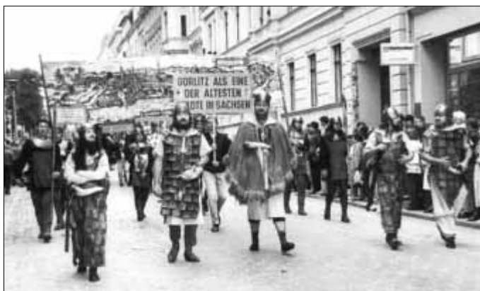
Der historische Festumzug war ein Höhepunkt des 1. Görlitzer Stadtfestes.