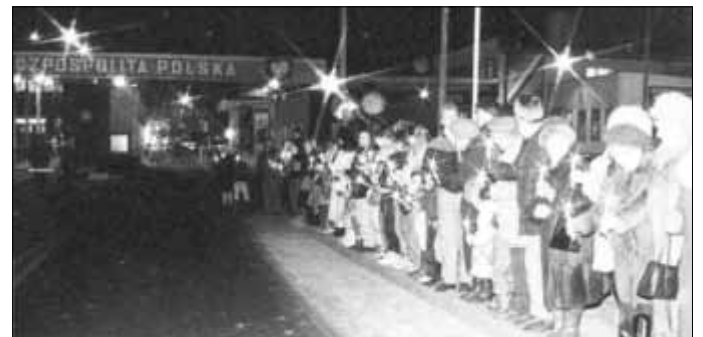
Auf der Stadtbrücke fanden sich viele deutsche und polnische Bürger zu einer Lichterkette ein.