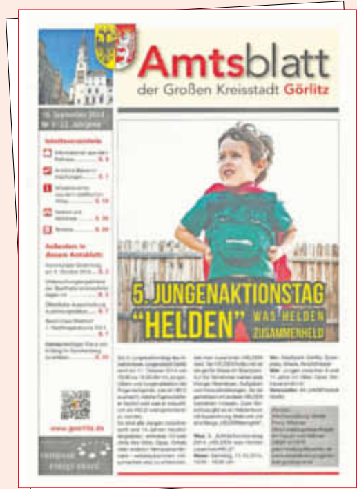
Ausgabe Nr. 9, 23. Jahrgang vom 16. September 2014