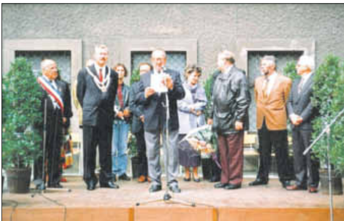
Die feierliche Amtseinführung von OB Lechner fand während des Stadtfestes am 17. September 1994 statt.