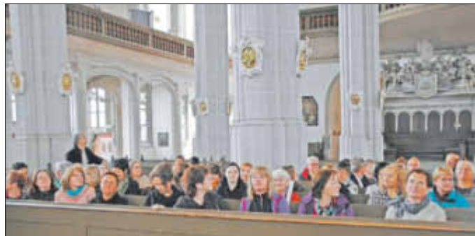
Das Konzert auf der Sonnenorgel in der Peterskirche war für alle ein beeindruckendes Erlebnis.

Es waren schöne Stunden, welche einen wichtigen Teil kultureller Arbeit in Görlitz erleben ließen und darüber hinaus die Verbindungen zwischen den Fachkollegen und -kolleginnen auf der polnischen und deutschen Seite festigen werden.