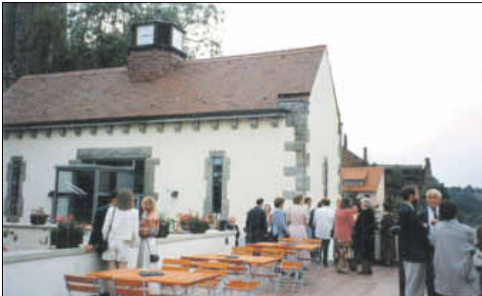
Vierradenmühle ist als Technikdenkmal und als Gaststätte harmonisch vereint