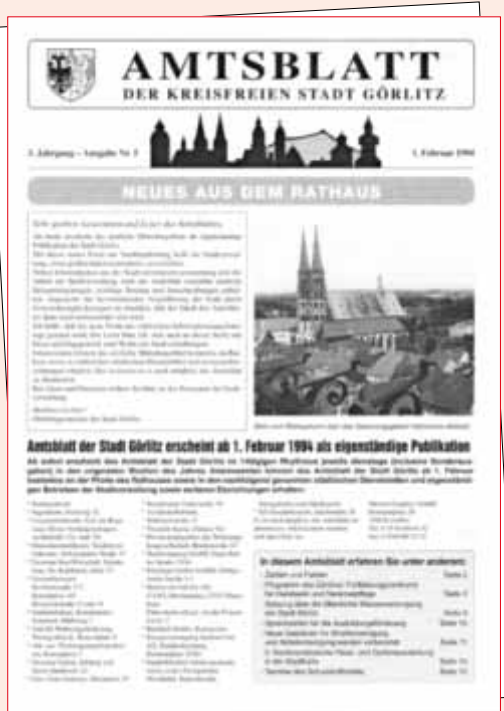
Ausgabe Nr. 5, 3. Jahrgang vom 1. Februar 1994

Und wie hat sich das Amtsblatt gestalterisch verändert?