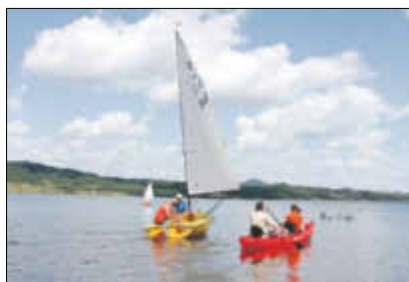
Foto: Berzdorfer See