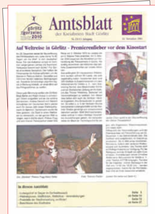
Ausgabe Nr. 23, 13. Jahrgang vom 16. November 2004