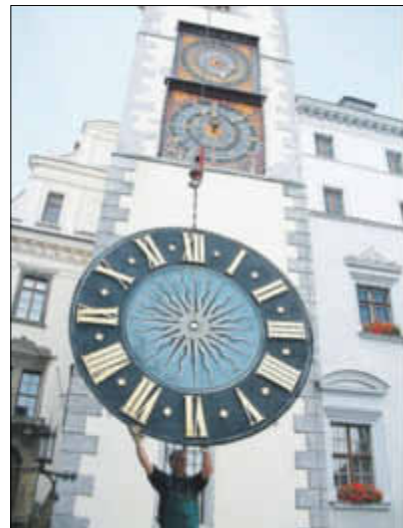
Uhren vom Görlitzer Rathausurm werden restauriert.