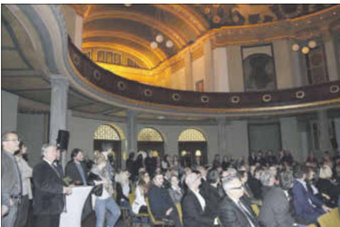
Die Gäste des Neujahrsempfanges kamen als erste Görlitzer in den Genuss, die neu sanierte Frauenempore der Synagoge, die im festlichen Licht erstrahlte, zu bestaunen.