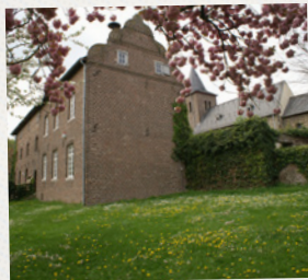
Historisches Ensemble Millen

Das historische Ensemble Millen mit der Propstei, der Zehntscheune und der über 1000 Jahre alten Kirche lässt dich in die Vergangenheit eintauchen. Der mit 15 Informationstafeln ausgestattete Ortsrundgang erzählt von historischen Geschehnissen, Überlieferungen Millener Bürger, Gebäuden, die leider nicht mehr existieren, Kurioses und Legendäres, was nicht in Vergessenheit geraten soll.