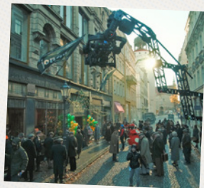
Der Star ist die Stadt

Das Filmedrehen hat in Görlitz eine lange Geschichte. Mittlerweile sind über 120 Filme und Serien in Görlitz entstanden – haltet stets die Augen offen, hier weiß man nie, ob man gerade Zeuge einer oscarverdächtigen Filmproduktion wird oder einfach so einem Weltstar auf der Straße begegnet. Auf unserer 4,7 km langen AudioGuide-Tour kannst du über 30 originale Görlitwood-Drehorte besuchen und dabei den einen oder anderen Blick hinter die Kulissen werfen.