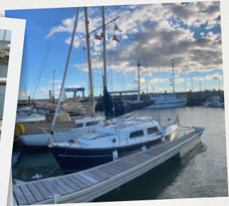
...am Lister Hafen

Zwei Leuchttürme und ein turbulenter Hafen mit Fähranleger schaffen das unverwechselbar maritime Flair des Ferienortes List auf Sylt. Hier kannst du dich mit feinsten kulinarischen Köstlichkeiten aus dem Meer versorgen. Der Charme von List liegt zwischen der Exklusivität Sylts und friesischer Gemütlichkeit und ist ein echtes Unikat.